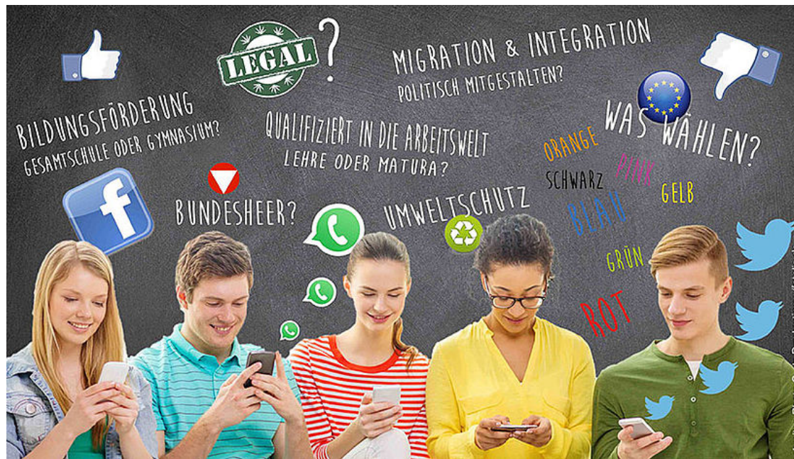
Die politischen Alltagserfahrungen von Jugendlichen in Österreich ... (Grafik: Institut für Publizistik- und Kommunikationswissenschaft)

Aufmerksam die Umwelt erkunden, fotografieren, kommentieren – und mit Glück einen "Citizen Science Award" gewinnen: In einem aktuellen Projekt am Institut für Publizistik- und Kommunikationswissenschaft werden SchülerInnen zu ForscherInnen und sammeln via Smartphone politische Alltagserfahrungen.